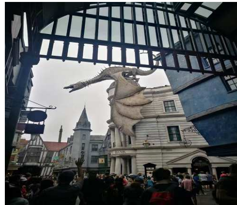
(b) Universal Orlando Resort