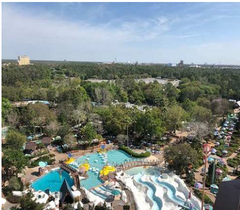
(a) Disney's Blizzard Beach Water Park

春休みの間、私はクラスメイトたちと一緒に3泊4日でフロリダへ旅行に行きました。今月、フロリダ州の平均気温は20度でした。そのため、私たちは薄着で図4(a)に示すDisney's Blizzard Beach Water Parkや図4(b)に示すUniversal Orlando Resortなどを訪れることができました。図4(b)に示しているUniversal Orlando Resort内にあるオリバンダーの店では実際にパーク内で使える魔法の杖と魔法が使えない杖が販売されています。そして、私達はオリバンダーの店で魔法が使える杖を購入して、魔法が使える25か所のスポットを巡りました。旅行中、私たちは色々な施設を訪れたため歩き疲れましたが、大変良い気分転換になりました。