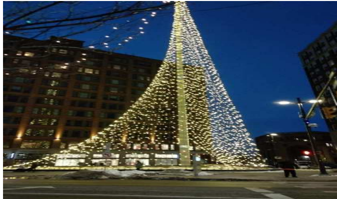
図1. 市内にあるイルミネーション

寒さもようやく衰え始め、春風が心地よい季節となりました。今月に入り暖かい日が続いているので、キャンパス内の雪が溶け始めています。また、ロチェスター工科大学（以下、RIT）では、3月10日から1週間の春休みを迎えていました。春休みの間、学内にある食堂やカフェなどは営業していません。そのため、私と友人たちは春休みの初日に食べ物を求めてロチェスター市内を散策していました。その際に、私たちはThe Strong Museumや美味しいモヒートを提供しているレストランなどを訪れました。もしあなたが3月にロチェスター市内を散策すれば、図1に示すイルミネーションを見ることができるでしょう。3月分の報告書には、今学期に私が履修している授業内容及び米国での出来事などを報せます。